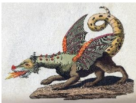
Friedrich Johann Justin Bertuch, Drache, 1806