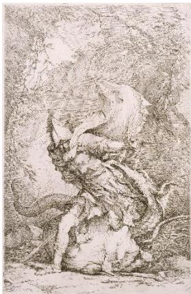
Salvator Rosa, Jason und der Drache, um 1663 © LACMA, gemeinfrei