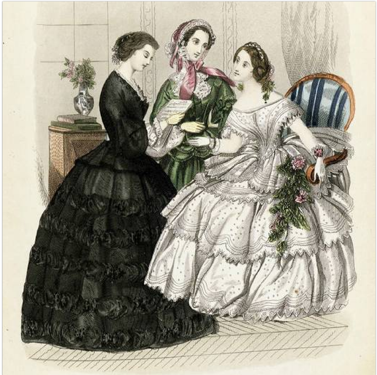
Diese Lithographie von 1828 zeigt modische Seidenstoffe.