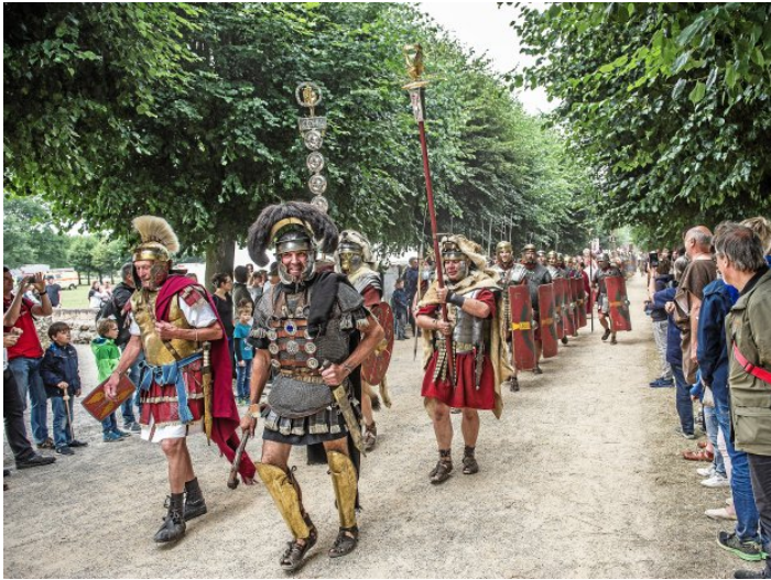
Die Römer waren hier... Das Römerfest „Schwerter Brot und Spiele“ im Archäologischen Park Xanten (APX) – hier ein Foto aus 2018 – erinnert daran.

In Ausstellungen, Lesungen, auf Exkursionen und bei Mitmachaktionen ergründen die über 30 Partnerorganisationen, was Provinz ist und was sie den Menschen bedeutet. Die Expeditionen in das Land zwischen den Metropolen zeigen vor allem eins: Provinz ist Heimat und Ankerpunkt, vielgestaltiger Lebensraum und künstlerisches Experimentierfeld.